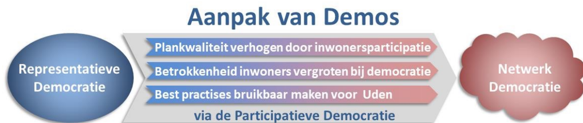
Figuur 2. Aanpak Demos in drie sporen

Zoals eerder aangegeven is het belangrijkste kenmerk van onze aanpak de focus op de procesgang. Centrale vraag in ons handelen is; 'Hoe kunnen we allen gezamenlijk leren van het participatieproces opdat we een volgende keer een nog effectiever participatieproces kunnen inrichten en realiseren?'. Het 'gezamenlijk leren' is het meest effectief door het te doen, te ervaren. Dit willen we doen langs drie sporen, die we in dit hoofdstuk toelichten.